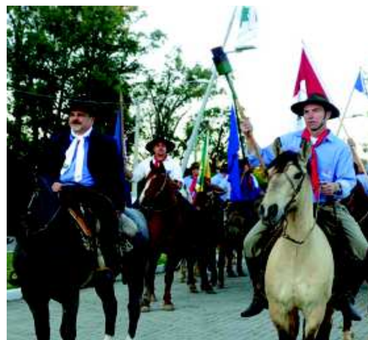
Desfile encerrara semana farroupilha